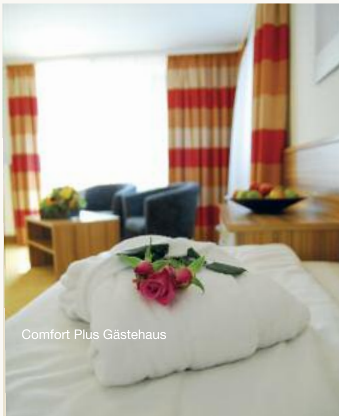
Comfort Plus Gästehaus