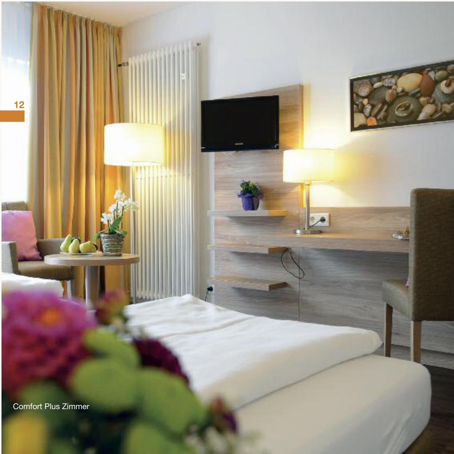
Comfort Plus Zimmer