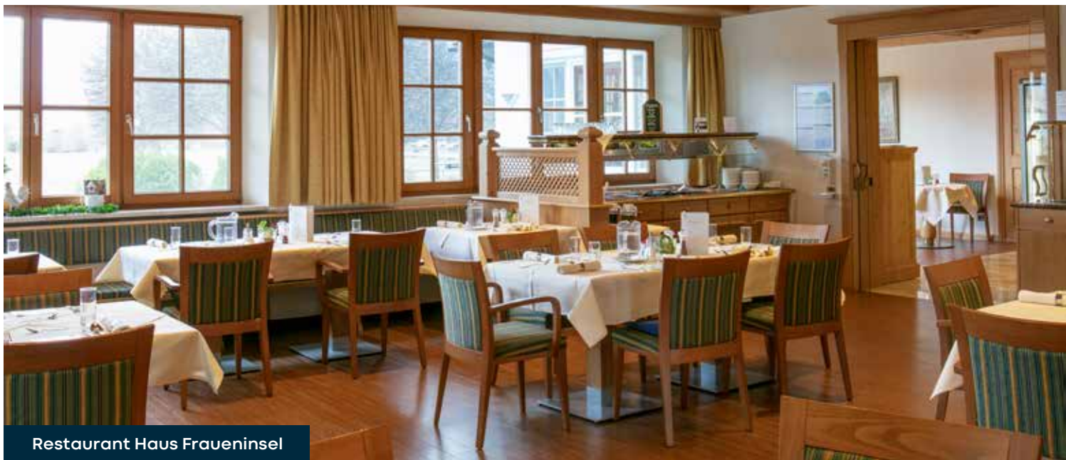
Restaurant Haus Fraueninsel