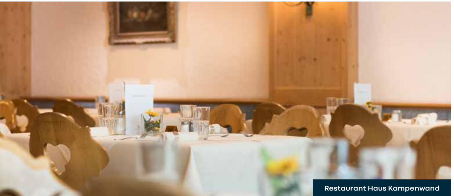
Restaurant Haus Kampenwand