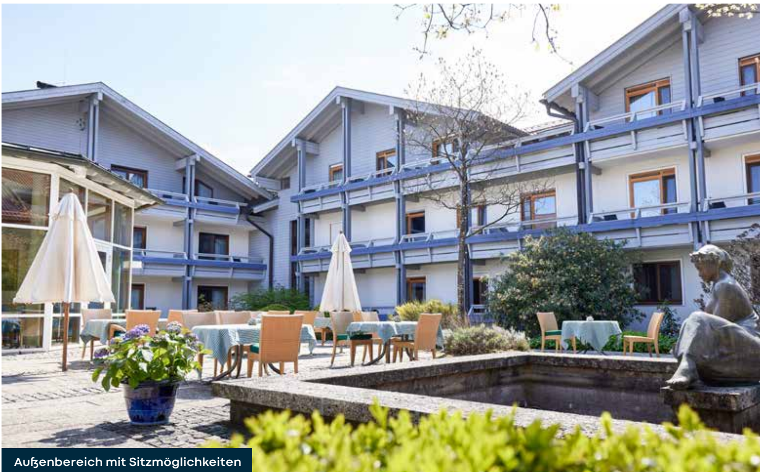
Außenbereich mit Sitzmöglichkeiten