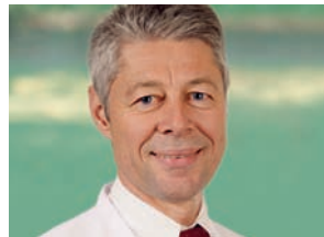
Prof. Dr. med. Thomas Wessinghage Ärztlicher Direktor Chefarzt Orthopädie/Traumatologie/ Sportmedizin